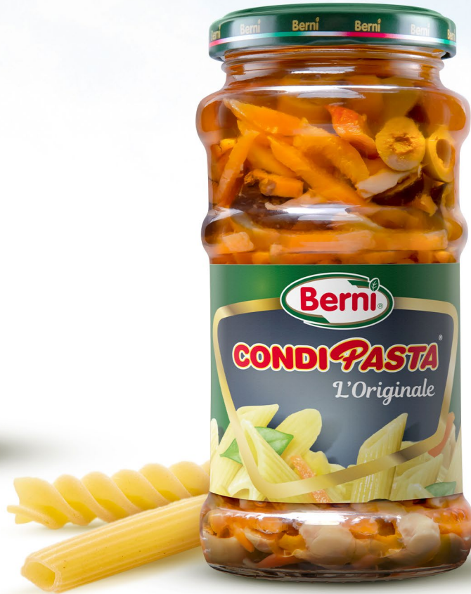
BECOP4958 | 316 ml