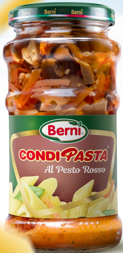
BECOP5665 | 316 ml