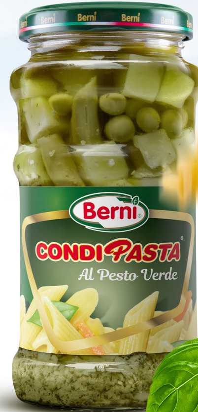
BECOP5666 | 316 ml